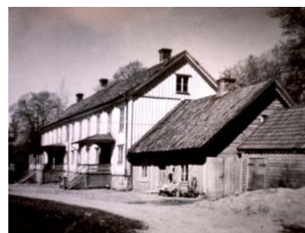
Fasader mot väster (riktning nordöst)