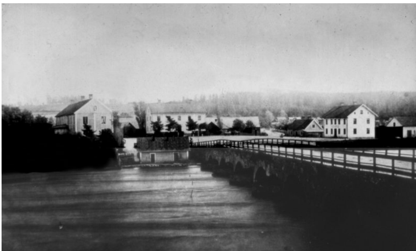
Gästistorget från Strömkronan