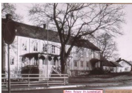
Fasad mot väster (riktning sydöst)

Ekonomibyggnaderna, ladugård m.m. låg år 1806 mitt emot gästgivaregården, på andra sidan av landsvägen och tätt intill denna, men år 1848 voro de belägna från vägen, inom det område, som utgör nuvarande kvarteret Vätterviken.