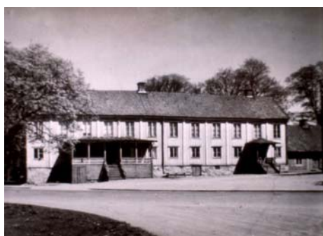
Fasad mot väster (riktning öst)