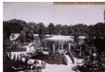
Gästisparken omkring sekelskiftet

Gästisbyggnaden revs i slutet av maj månad 1964 endast den kulturhistoriskt intressanta källaren från hertig Johans tid sparas. Av bebyggelsen på området kvarstår också brygghuset eller bagarstugan vid sista brokaret. På en teckning som förvaras i museet finns brygghuset och kyrkan återgivna. Teckningen är daterad år 1810. Huset torde alltså vara ett av samhällets äldsta